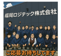
ご応募お待ちしております

「話だけ聞いてみたい」という相談でもOKなので、気になる人がいたらご連絡下さい！ご協力、よろしくお願い致します。