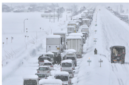
(参考)高速道路を走行中に突然の大雪で立ち往生が発生！ こんなときどうすればいい？ https://jafmate.jp/safety/what-would-you-do_20250107.html