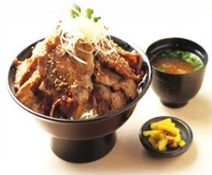
「炙り焼き丼・ドン」の「とん井」 お味噌汁とお新香が付き並盛 800円

ここの「とん井」は県内でも名産として知られる行方市の豚バラ肉を使用。まず、特製の甘辛いタレに漬け、網を使い炙り焼きにしています。その肉をキャベツが乗ったご飯の上に豪快に載せたどんぶり飯です。