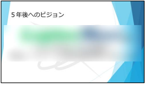
【発表用スライド(実物)】

ビジョンの全貌は残念ながら今はお見せできず シークレット にしていますが、7月31日の経営大会で満を持して発表されます。ビジョン委員会は今後、このビジョンを見据えながら5年かけて様々な取組みを行うことになっています。